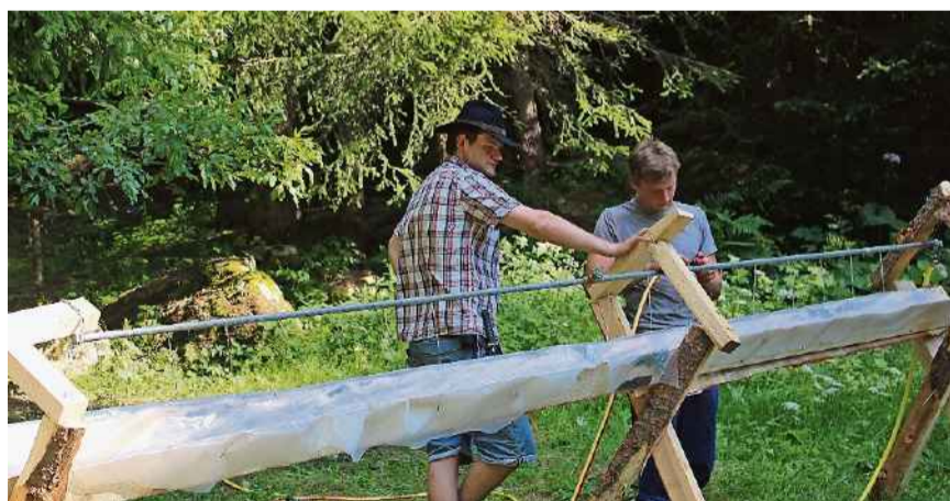
Keine Zeit zum Faulenzen, das Lager muss aufgebaut werden.