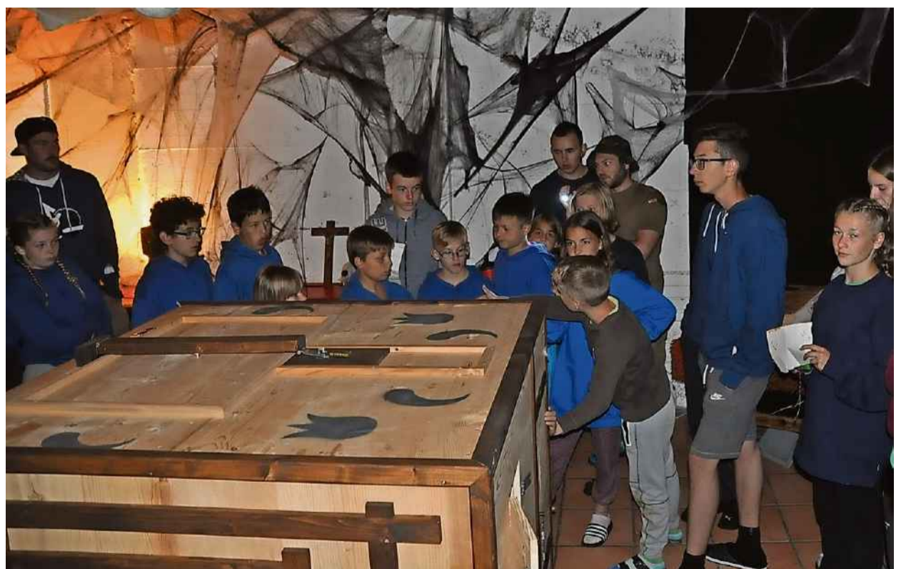
Ein Fach der Rätselkiste wird geöffnet.